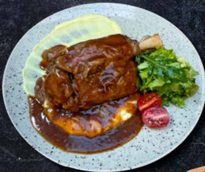
ТОСКАНСКИЙ РУЛЬКА вареная рулька (700 г) в соусе демиглас и картофельном пюре