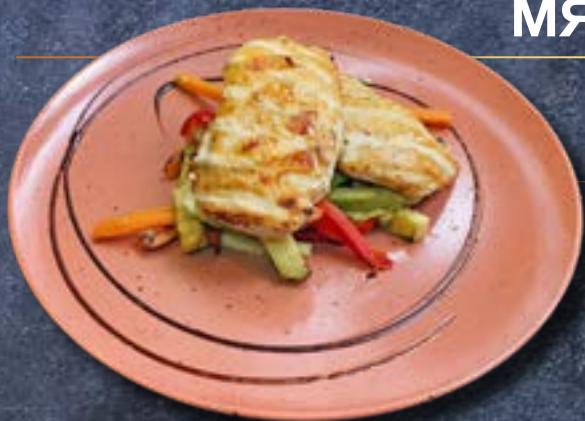
АРОМАТНАЯ ЦЫПЛЯТИНА с легкими кремовыми ньокками