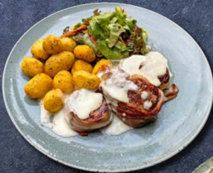
МЕДАЛЬОНЫ - РУЛЕТ ИЗ СВИНИНЫ в соусе из каймака, с молодой картошкой и салатом