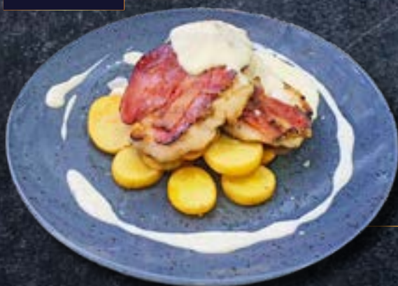
ЗАПЕЧЕННАЯ ЦЫПЛЯТИНА с прошутто и пармезаном, подается с ароматной картошкой в трюфельном масле и соусом из пармезана