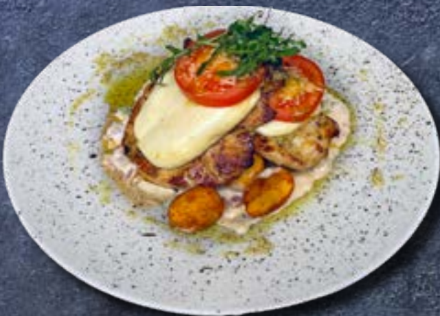
КАПРЕЗЕ ИНДЕЙКА филе индейки, моцарелла, помидор под соусом из кабачка и прошутто