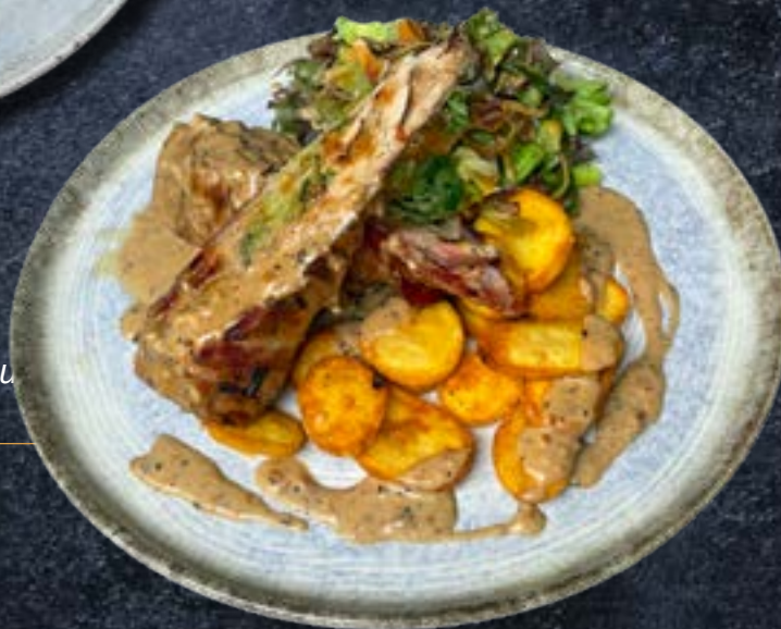
ФИЛЕ "NOISETTE" свиное филе с начинкой из брокколи и соусом из лесного ореха